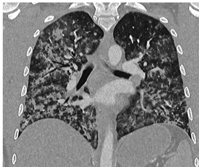
Abb. 1 ◀ Computertomographie (CT) des Thorax und des Abdomens (arterielle Phase, Lungenfenster, koronare multiplanare Reformation [MPR]): kleinfleckige Infiltrate mit alveolären Hämorrhagien beidseits

Laborchemisch zeigte sich ein Kreatinin von 8,2 mg/dl, entsprechend einer geschätzten glomerulären Filtrationsrate (eGFR) nach CKD-EPI (Chronic Kidney Disease Epidemiology Collaboration) von 8,1 ml/min/1,73 m 2 . Zudem war eine Bilirubinämie von 8,9 mg/dl (Norm: < 1,2 mg/dl) auffällig mit einer Cholinesterase (CHE) von 3,28 kU/l (Norm: 5,32–12,92 kU/l) im Sinne eines akuten Leberversagens.